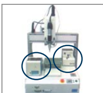
NJR mit Roboter