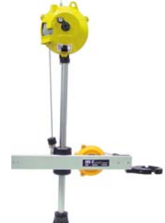
easy-linearfix-Tele Dreiachsiger Entlastungsarm