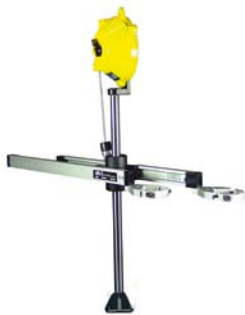
easy-linearfix-Twin für 2 Schrauber