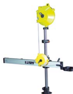
easy-linearfix-B mit Anschlägen